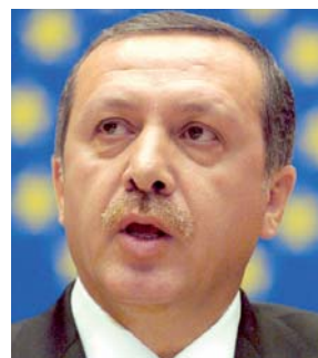
رئيس الوزراء التركي، رجب طيب أردوغان

● تحوّل التوقيت الصيفي المطبق منذ الفاتح جوان بولايات الجنوب العشر إلى هاجس بالنسبة للموظفين، وخاصة العنصر النسوي اللاتي عبرن صراحة عن عدم رضاهن بمواعيد الدخول والخروج، حيث يجبرن على إبقاء صفارهن باكرا والتوجه بهم إلى المريات، وما زاد الطين بلة أن العودة إلى المنزل تكون في زمن القيلولة في وقت يختبئ الجميع في منازلهم ويصعب إيجاد وسيلة نقل، ذاهب عن خطر الاعتداءات.