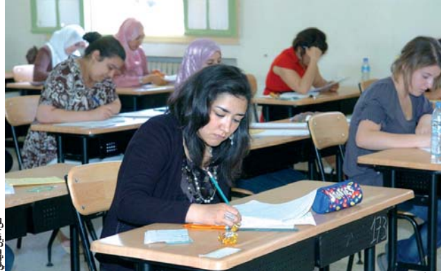
أحد أقسام الامتحانات

وفي ذات الثانوية، التقينا بشبان سمعناهم من بعيد يذكرون أسماء بعض اللاعبين بالمنتخب الوطني