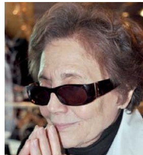
المجاهدة جميلة بوحيرد

بأن حادثي أسر المجاهدة جميلة بوحيرد واستشهاد والده كانتا بداية انطلاق عمله السياسي من حيث مشاركته في تنظيم تجمعات المساندة وتوزيع صور الشهيد عميروش وبيعها لقادة الثورة التحريرية.