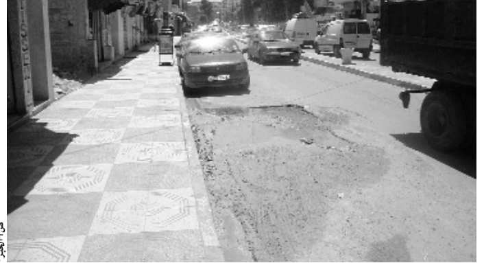
مشاريع باهضة التكلفة لا فعالية لها في الواقع

كشفت تقارير رسمية أن مشاريع التهيئة والري وحماية المدن من الفيضانات بولاية تبسة كلفت خزينة الدولة أكثر من 2000 مليار سنتيم بين سنتي 2006 و2009 مقابل تصاعد تدمير المواطنين من رداءة الإنجاز.