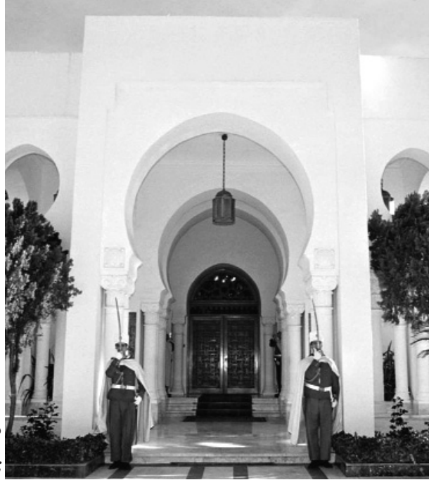
مقر رئاسة الجمهورية

الحرس الجمهوري في إطلاق النار ما أدى به للانعطاف ثانية عبر ممر آخر يؤدي نحو مقترب الطرق الرئيسي للمرادية، ليجد قبالة عشرات رجال الأمن الذين شرعوا في إطلاق النار في كل صوب نحو السيارة "المصفحة". ونقل ضابط شرطة