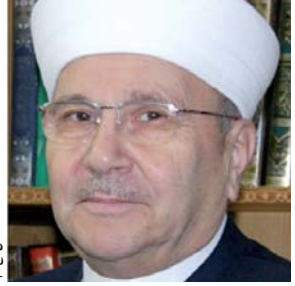
الدكتور محمد راتب النابلسي