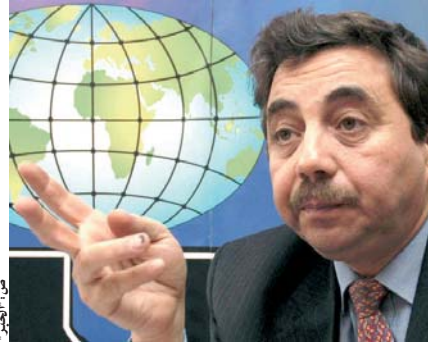
المدير العام للجمارك

وحسب مصدر له علاقة بالتحقيق، فإن الشركة المعنية لجأت إلى التصريح الكاذب قصد تهريب العملة، وأكثر من ذلك فإن الشركة، تصف مصادراتنا، تعتمد إدخال الحديد من إيطاليا إلى الجزائر عن طريق تونس، لتهريب من دفع الحقوق الجمركية. وهو ما تضمنته شكوى تم تسليمها لوزير المالية لمباشرة تحقيق في نشاط الشركة. خ.ل