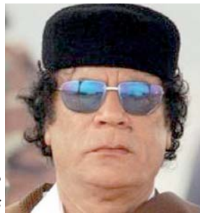
الزعيم الليبي أم عمر القذافي

بأن حادثي أسر المجاهدة جميلة بوحيرد واستشهاد والده كانتا بداية انطلاق عمله السياسي من حيث مشاركته في تنظيم تجمعات المساندة وتوزيع صور الشهيد عميروش وبيعها لقادة الثورة التحريرية.