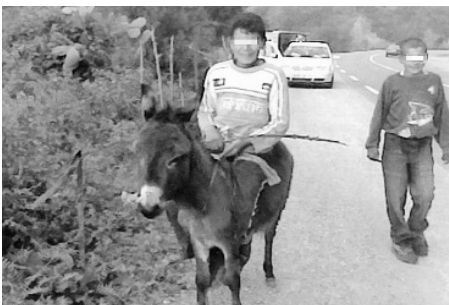
تم تعدد التسويقات والدعوة للسير تجدي أمام واقع لا يطاق

● طالب القاطنون بدوار المشتة، الواقعة بمحاذاة الطريق الوطني رقم 85 عند المدخل الشرقي لبلدية مالوس بسكيكدة، بالتدخل العاجل للمسؤول الأول عن الجهاز التنفيذي قصد تعبيد الطريق المؤدي إلى دوارهم وتزويدهم بالإنارة العمومية، وانتقدوا صمت السلطات المحلية إزاء وضعهم رغم مراسلاتهم العديدة. أبدى سكان المشتة استياءهم الشديد للوضعية المزرية التي يتخطون فيها في رسالتهم الاحتجاجية الموجهة لوالي الولاية، وأضافوا أنهم ملأوا علبات "اصبروا الشهر الداخل"، مؤكدين تعهد السلطات المحلية عدة مرات بقراب الآجال، لكن لا شيء تغير، حسب الموقعين على الرسالة الاحتجاجية. وطالبوا الجهات الوصية بالتدخل العاجل، حيث تصبغ الحركة على مستوى دوارهم شبه مستحيلة، محملين السلطات الوصية مسؤولية معاناتهم مع الطريق والعزلة التي يتخطون فيها.