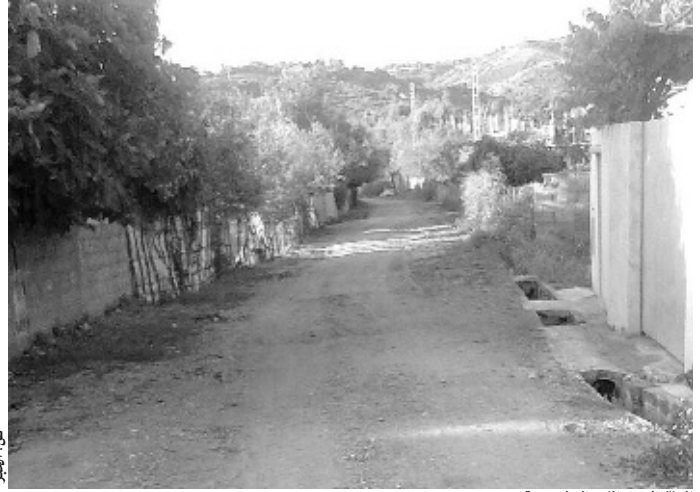
المسلك الوحيد المؤدي إلى لحميمرة

عبر سكان حي لحميمرة ببلدية الشقة بجيجل عن تذرهم من الوضعية المزرية التي يعيشونها، جراء العزلة الخائفة التي تشهدها المنطقة منذ الإستقلال، والتي ازدادت حدتها في الآونة الأخيرة.