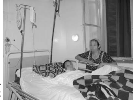
المرضى في حاجة إلى رعاية متخصصة

أدخل نقص الرعاية الطبية المتخصصة لبعض الأمراض، المستعصية العلاج بتلمسان، العديد من المرضى في أجواء نفسية، خيم عليها اليأس والاستسلام للداء، لاسيما منهم المصابون بداء السرطان، الذي استغل، بسبب عدم التشخيص المبكر.