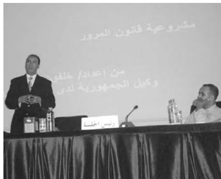
جانبا من الحاضرة

التي أقرها قانون المرور، في تعزيز الثقافة المرورية، مستدلا على ذلك بالقراءة التحليلية التي كانت نتاج معالجة ميدانية لحوادث وجرام المرور، وهو السياق الذي سارت اليه مداخلة الضابط زداك ياسين، التي غلب فيها ما وصفه باستراتيجية الدولة لحد من قانون المرور من خلال النصوص ذات الصلة.