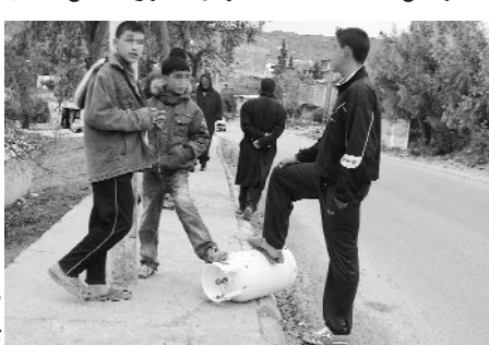
خدمات لا تشمل التأجيل لا تزال في مرحلة الدراسة

● لاتزال مئات من العائلات بمدينة راس لعيون بباتنة محرومة من الغاز الطبيعي، مما أثار احتجاج السكان القاطنين بالأحياء التي لم تمتد إليها شبكة الغاز منذ توصيله وتشغيله عبر العديد من الحياء السكنية بالمدينة في 2005.