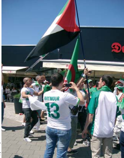
انصار الخضر يرفعون الراية الفلسطينية في نورمبرغ الألمانية

لم تكن الرايات الجزائرية الوحيدة من لونت مدرجات ملعب مدينة نورمبرغ الألمانية في المباراة الودية التحضيرية، التي جمعت منتخبنا الوطني مع منتخب الإمارات، فقد كانت الرايات الفلسطينية حاضرة بقوة، تعبيرا من الإيجابية الجزائرية في أوروبا عن مساندتهم غير المشروطة للأشقاء الفلسطينيين وللمحاصرين في غزة.