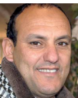
الفنان الراحل كاتشو

● أظهر حفل تكريم إذاعة عنابة الجهوية لابن الفنان الشاوي الراحل كاتشو، الاختلاف الكبير بين الأب والابن، ففي الوقت الذي كان الجميع يتوقع بأن الابن سيحمل الميكروفون ويؤدي بعض أروع وأجمل ما تركه والده الفقيه من أعاني الفن الشاوي العصري، أسر كاتشو الصغير إلى الحضور بأن تشريفه لأبيه وإذاعة عنابة التي كرمته سيكون بفن مداعبة كرة القدم التي يمارسها متميز في أواسط اتحاد عنابة. وضرب ابن الفنان الراحل للجميع موعدا للالتقاء باسم أبيه في الفريق الوطني.