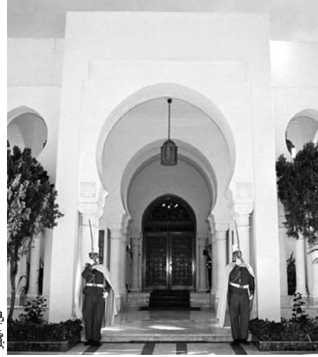
مقر رئاسة الجمهورية

شهد مقر رئاسة الجمهورية والأحياء المحيطة به بالمرادية بالعاصمة، أمس، حالة من الذعر، إثر محاولة اقتحام سيارة مبنى الرئاسة كان يقودها نجل الجنرال المتقاعد، محمد عطائيلية، وعقب مطاردة للسيارة عبر شارع أوغليس مروراً بمقترب الطرق قبالة الرئاسة وإلى غاية البوابة القريبة من وزارة الخارجية ثم الممر المؤدي للمدخل الرئيسي، جرى توقيف السيارة بعد عملية إطلاق نار مكثفة لم تؤد إلى إصابة السائق.