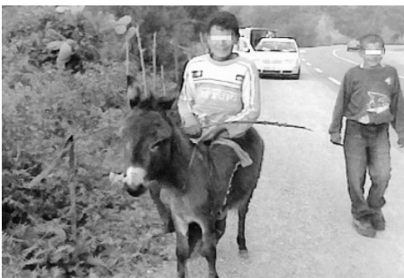
تم تعدد التسويقات والدعوة للسير تجدي امام واقع لا يطاق

● طالب القاطنون بدوار المشتة، الواقعة بمحاذاة الطريق الوطني رقم 85 عند المدخل الشرقي لبلدية تمالوس بسكيكدة، بالتدخل العاجل للمسؤول الأول عن الجهاز التنفيذي قصد تعبيد الطريق المؤدي إلى دوارهم وتزويدهم بالإنارة العمومية، وانتقدوا صمت السلطات المحلية إزاء وضعهم رغم مراسلاتهم العديدة.