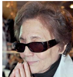
المجاهدة جميلة بوحيرد

بأن حادثي أسر المجاهدة جميلة بوحيرد واستشهاد والده كانتا بداية انطلاق عمله السياسي من حيث مشاركته في تنظيم تجمعات المساندة وتوزيع صور الشهيد عميروش وبيعها لقادة الثورة التحريرية.