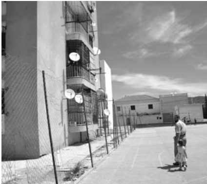
حي 110 مسكن

حفياتهم على مدى الثمانية أشهر الأخيرة. وقالوا إن السلطات المعنية مارست التحايل على الوالي، عندما قامت بقطع المياه عن باقي أحياء لسدي عكاشة يوم زيارة الوالي للحى، من أجل إظهار أن العمارة الجديدة تتوفر على هذه المادة الحيوية. لكن الواقع خلاف ذلك تماما.