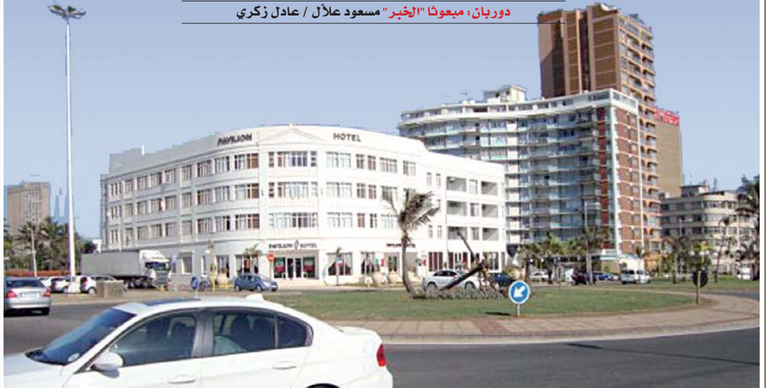
وسط مدينة دوربان بجنوب إفريقيا

دوربان، مبعوثا "الخبر" مسعود علاّل / عادل زكري