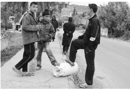
خدمات لا تشمل التأجيل لا تزال في مرحلة الدراسة

● لاتزال مئات من العائلات بمدينة راس لعيون بباتنة محرومة من الغاز الطبيعي، مما أثار احتجاج السكان القاطنين بالأحياء التي لم تمتد إليها شبكة الغاز منذ توصيله وتشغيله عبر العديد من الحياء السكنية بالمدينة في 2005. وقد وجه سكان حي الرابطة الشمالية الذي يضم 348 مسكنا فرديا وكذا سكان حي 150 مسكنا اجتماعيا العديد من الشكاوى إلى السلطات البلدية والولاية منذ عدة سنوات، إلا أن طلباتهم لم تتحقق لحد الآن، مما يزيد من معاناتهم للحصول على قارورات الغاز، خاصة أثناء فصل الشتاء. من جهته أوضح رئيس البلدية بأن هذا المطلب الشرعي للمواطنين، كان محل إشغال