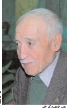
عبد الحميد كرمالي

● أكد شيخ المدربين عبد الحميد كرمالي في تصريح خص به "الخبر" أن المباراة الأخيرة للمنتخب الوطني أمام نظيره الإماراتي، أظهرت بعض الإيجابيات، إلى جانب بعض النقص. وفيما يخص الجانب الإيجابي قال كرمالي "لاحظت أن المنتخب محضر بشكل جيد من الناحية البدنية. كما لاحظت أن الانسجام بين عناصر المنتخب بدأت تتجلى، من خلال التمريرات العديدة بين اللاعبين، كما أن