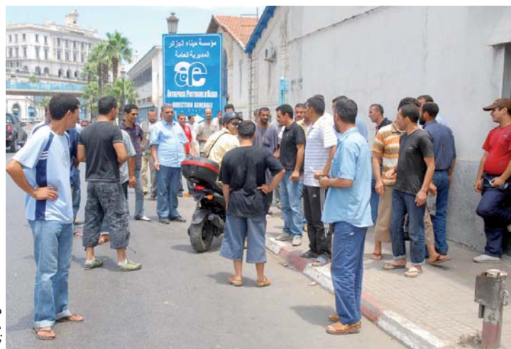
عمال ميناء العاصمة يجتمعون في وقتهم الاحتجاجية

● أكد الأمين العام للفيدرالية الوطنية لعمال الموانئ، أمس، بأن 14500 عامل ينشطون على مستوى عشر مؤسسات مينائية متواجدة بالوطن، سيتقاضون الزيادات المقررة في رواتبهم في إطار اتفاقيات الفروع، نهاية الشهر الجاري، بأثر رجعي ابتداء من جانفي الفارط.